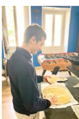
Fraternité 3 R+3